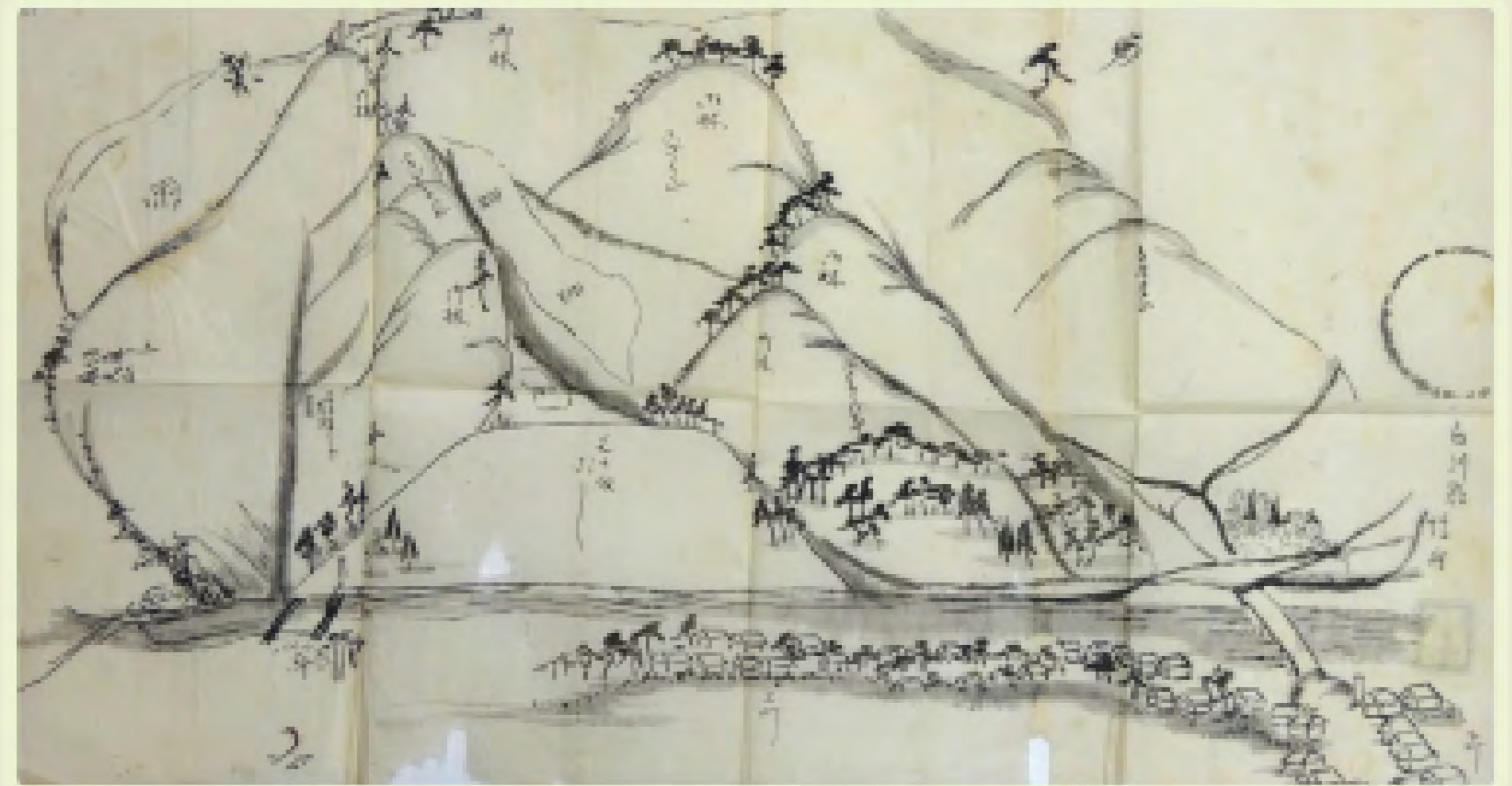
〔陸奥国白川郡埴村山林絵図〕 秦太一郎家文書 243