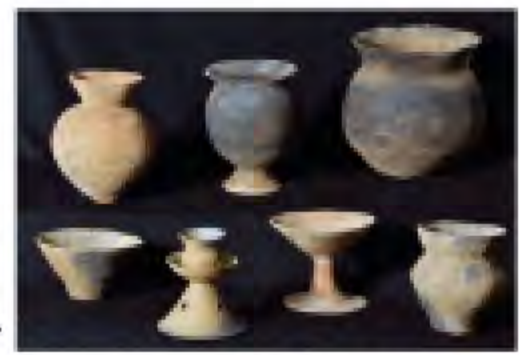
西郷村瀧南遺跡土師器

開催中～5/6(月・振休) 戦後ふくしまの考古学2 —高度経済成長期の発掘調査— 所 白河市・県文化財センター白河館まほろん 時 9:30～17:00(最終入館16:30) 休 月曜日(4/29、5/6をのぞく)、4/30 ¥無料 図 まほろん(0248)21-0700 ※高度経済成長期の東北自動車道建設・東北新幹線建設に伴う発掘調査について、写真や出土遺物などから振り返る。