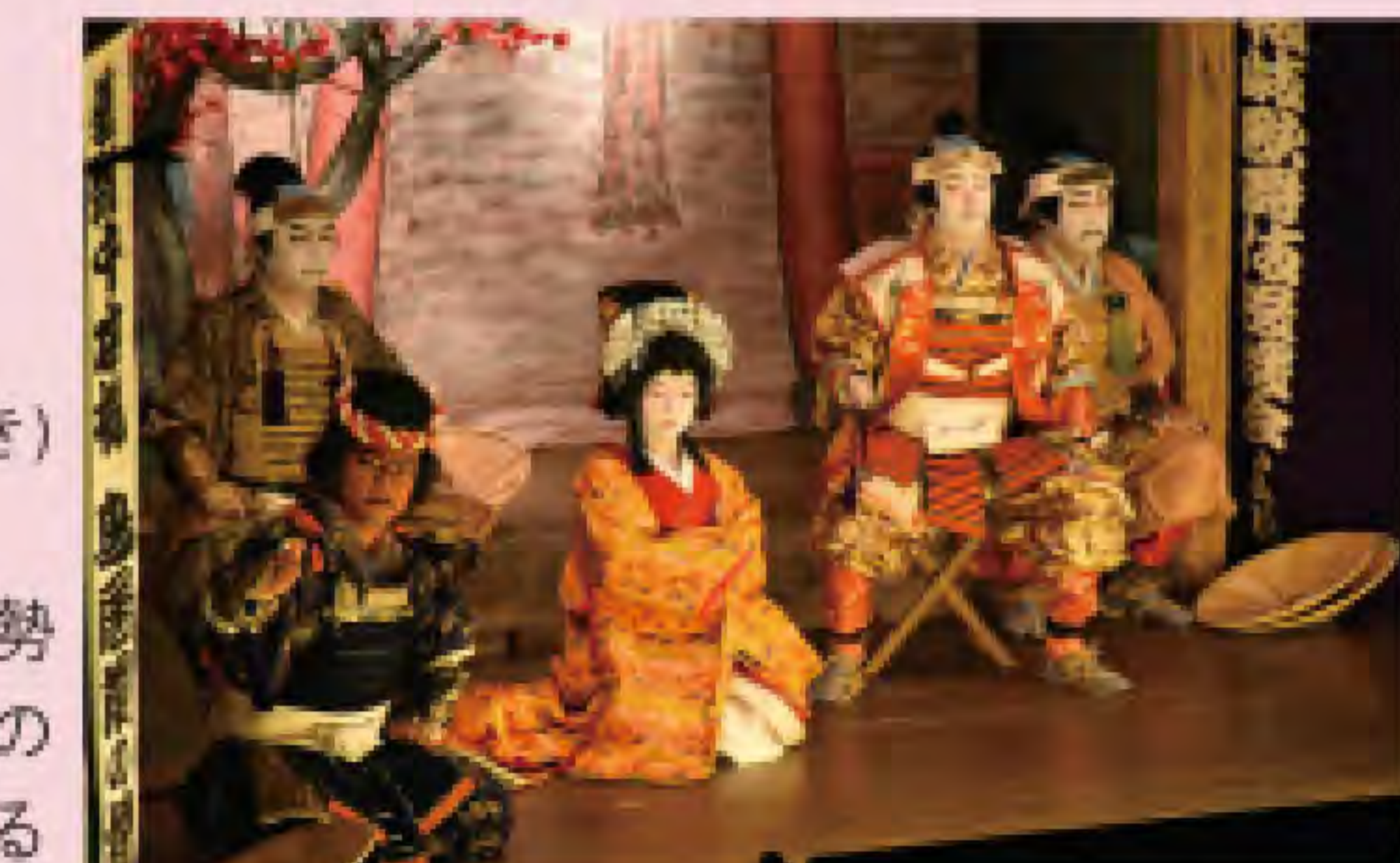
演目「義経千本桜 鳥居前の場」の一場面

檜枝岐の伝統芸能が福島市へやってくる 所 福島市・キョウウグループ・テルサホール(福島テルサ) 時 10:00、14:00 料 一般・大学生3,000円、高校生以下2,000円 (同日・同会場で開催のイベント「歳時記の郷 奥会津展in福島」で使用できるお買物券(300円分)付き) 出 千葉之家花駒座 問 福島民友新聞社営業局事業部(024)523-1334 ※福島民友新聞創刊130周年のプレ記念事業。檜枝岐歌舞伎は、江戸時代、村民がお伊勢参りの道中で見た歌舞伎を見よう見まねで伝えたのが始まりといわれ、現在も村内の「檜枝岐の舞台」(国指定重要有形民俗文化財)で年3回ほど上演している。村民でつくる伝承団体「千葉之家花駒座」が、現在残る11演目の1つ「義経千本桜 鳥居前の場」を上演する。