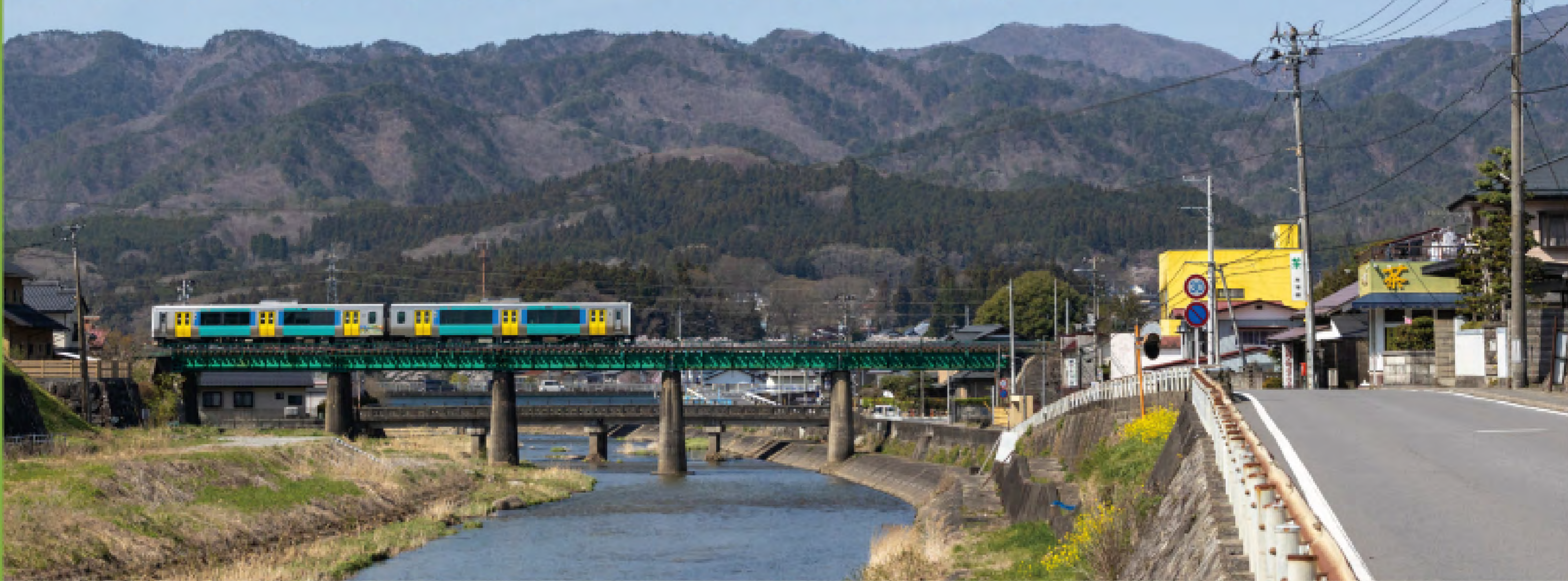
「埴村山林絵図」に描かれた川上川を渡る水郡線