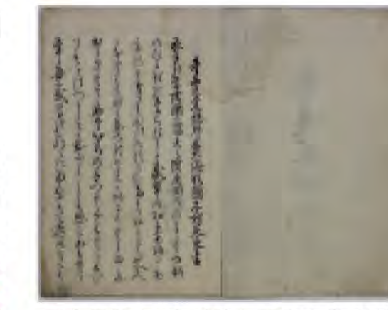
慶喜家陣文 完(鈴木正文書 613)

JR水郡線全線開通から90周年を迎えるにあたり、水郡線沿線地域(東白川郡)ゆかりの古文書を5か年にわたりシリーズ展として取り上げます。(詳細は表紙参照)