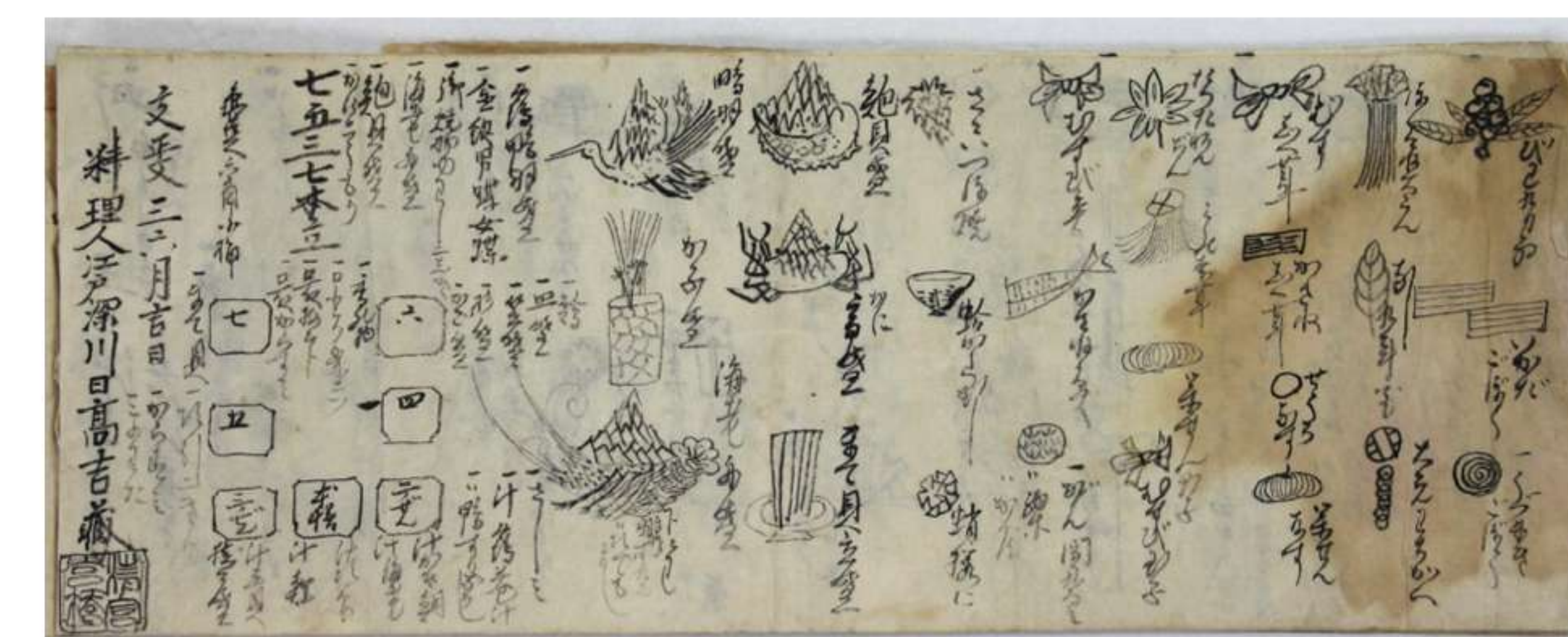
写真② 四季献立書 鉢帳(青砥惣一郎家文書 172)