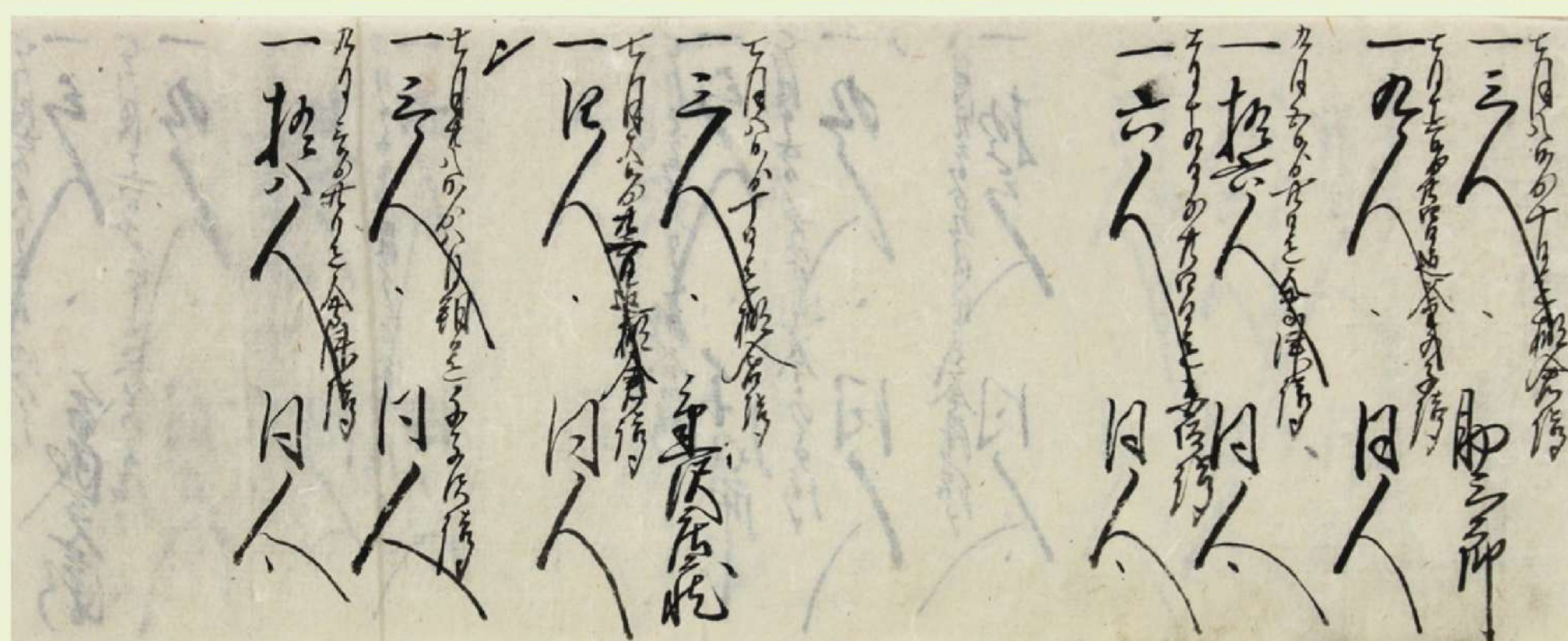
棚倉釜子二本松會津白川白坂門割人足調帳 吉成正大家文書 157