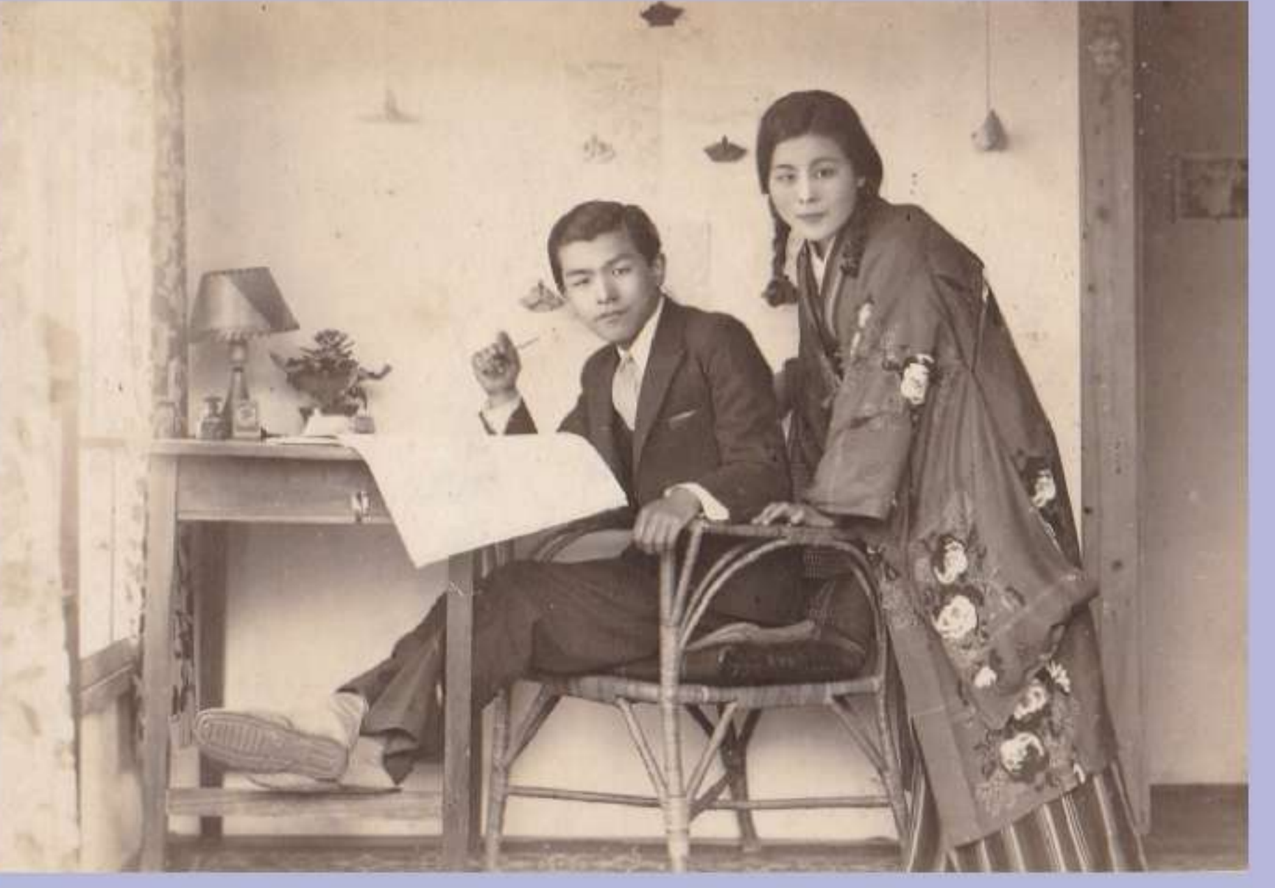
古関裕而と妻金子 1931年

注目 7/13(土)～9/23(月・振休) 障がい者無料 古関裕而展 —裕而と金子の往復書簡— 昭和を代表する作曲家と その妻の恋の軌跡を手紙でたどる 所 いわき市立草野心平記念文学館 時 9:00～17:00(最終入館16:30) 7・8月の土曜日は9:00～20:00まで(最終入館19:30) 休 月曜日(7/15、8/12、9/16、9/23をのぞく)、7/16、8/13、9/17 ¥ 一般440円、高校・大学生330円、小・中学生160円 問 文学館 (0246)83-0005 ※NHK連続テレビ小説「エール」の主人公のモデルにもなった福島市出身の作曲家・古関裕而と妻・金子。文通による遠距離恋愛の末に結ばれた二人の若かりし頃の書簡とともに、自筆楽譜などからその生涯と作品を紹介する。あわせて、古関が作曲した県内小・中学校校歌などの作詞を手がけた詩人・草野心平との知られざる交流も、書簡や写真からたどる。