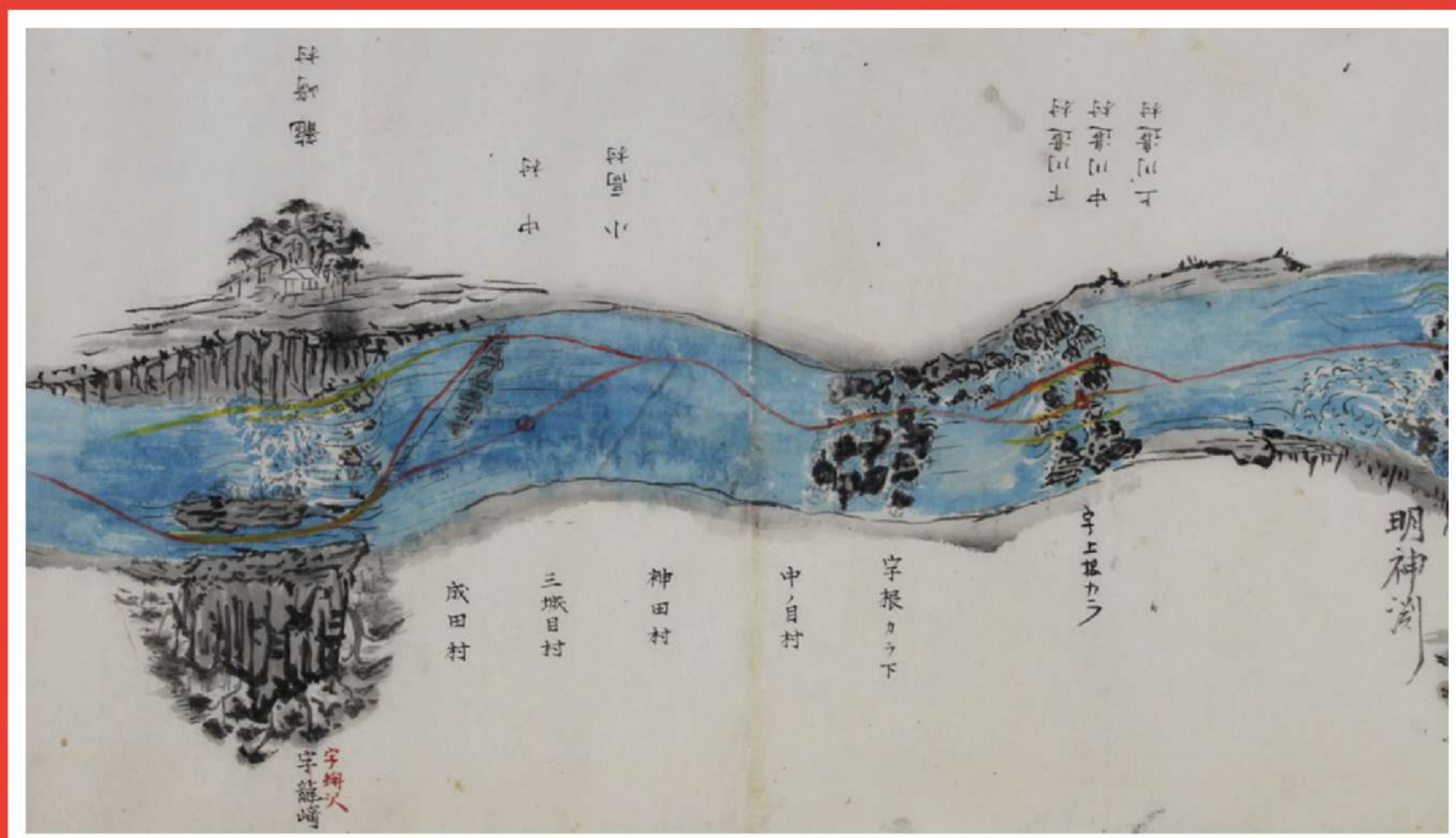
阿武隈川舟運絵図