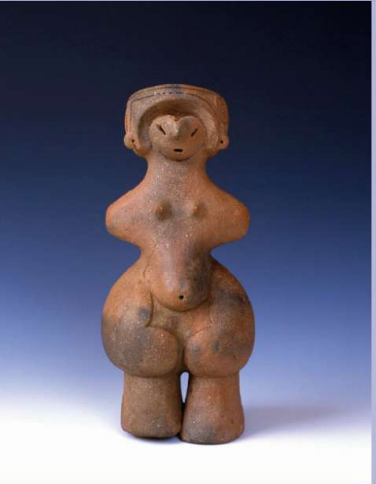
国宝「土偶」(縄文のビーナス) 茅野市蔵 ※展示期間7月6日～18日 この期間のほかはレプリカを展示

注目 7/6(土)～9/1(日) 障がい者無料 縄文DX—会津・法正尻遺跡と交流の千年紀— 国の重要文化財「法正尻遺跡出土品」が会津へ里帰り 所 会津若松市・県立博物館 時 9:30～17:00(最終入館16:30) 休 月曜日(7/15、8/12をのぞく)、7/16、8/13 ¥ 一般・大学生1,000円、高校生以下無料 問 博物館 (0242)28-6000 ※法正尻遺跡(磐梯町・猪苗代町)は、縄文土器のほか、ヒスイ製の珠などの装飾品、土偶などの祭祀具、石器など約26万点が出土し、うち855点が国の重要文化財に指定されている。本展は、国指定15周年を記念し、県文化財センター白河館まほろんで保管している優品を会津で公開する里帰り展。長野県茅野市で出土した国宝「土偶」(縄文のビーナス)の実物展示など、本県初公開品も紹介しながら、会津の地域間交流とそれを支えるネットワーク、縄文文化の十字路としての会津地域の特徴に迫る。