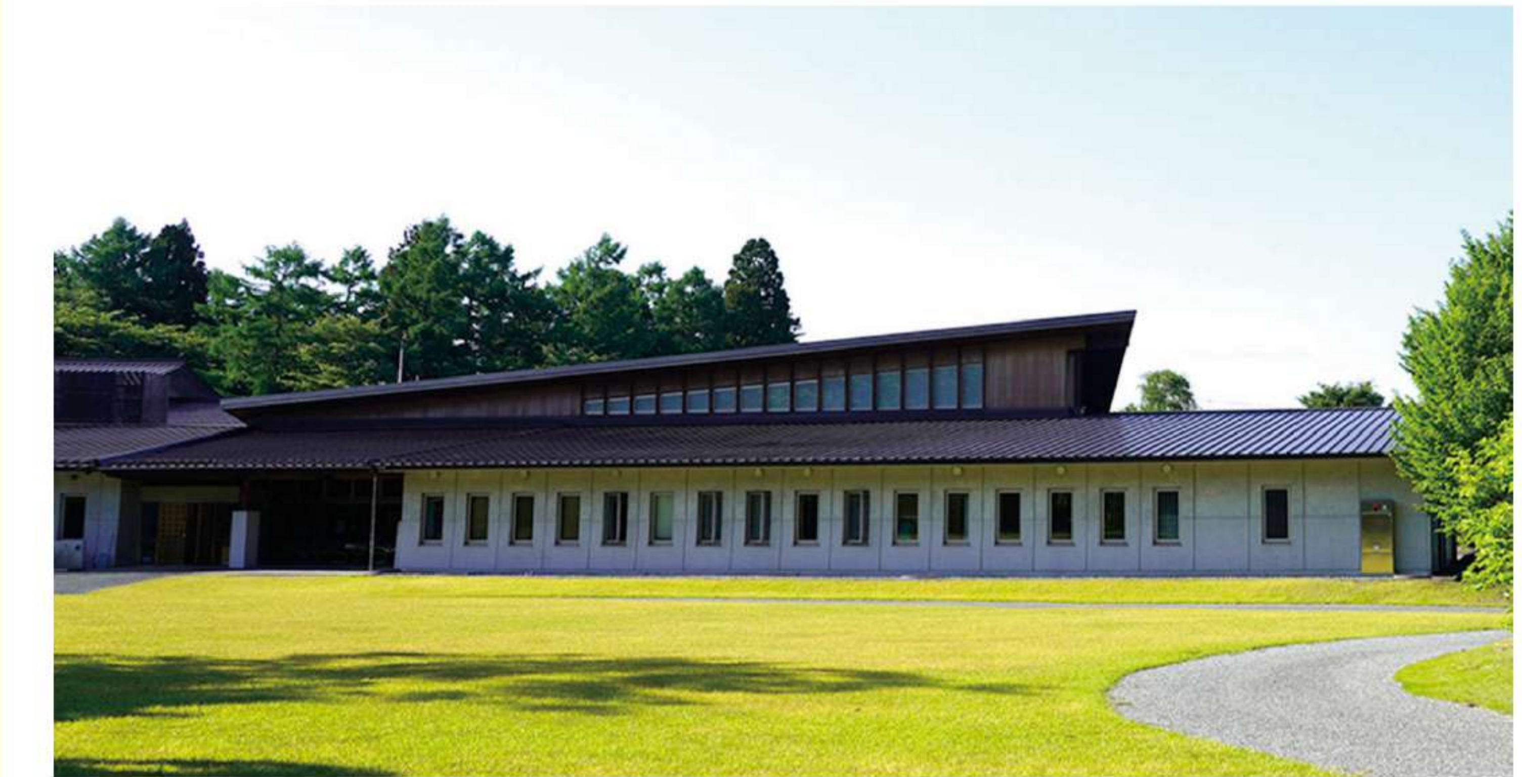
県文化財センター白河館まほろん

【日 時】8月4日(日)10:30、13:30 ※各回とも同じ内容、どちらかを選択 【会 場】白河市・県文化財センター白河館まほろん 【料 金】無料(要申込) 【講 師】同館職員 【問合せ】まほろん(0248)21-0700 ※各回先着20組(要申込、1組3名程度まで)。 7月3日(水)午前10時から電話にて受付開始。 小学校低学年以下が参加する場合は要保護者同伴。