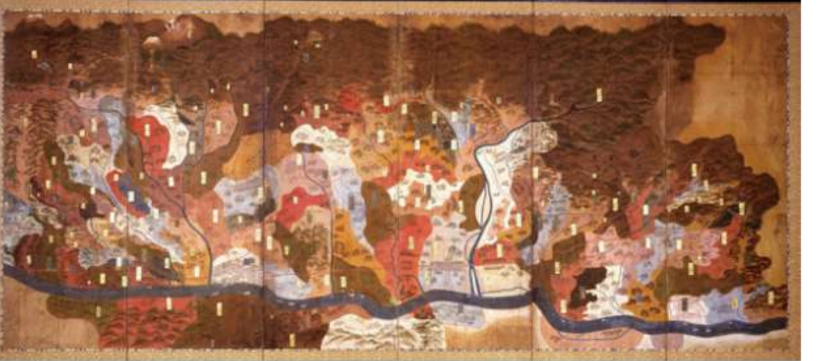
陸奥国信夫伊達惣検地高絵図屏風(安斎直巳家文書38)

8/3(土)～11/24(日) 収蔵資料展「阿武隈川流域の歴史と文化」 所 福島市・県歴史資料館 時 9:00～17:00(最終入館16:30) 休 月曜日(8/12、9/16、9/23、10/14、11/4をのぞく)、8/13、9/17、9/24、10/15、11/5 ¥ 無料 問 資料館 (024)534-9193 ※詳細は表紙参照。