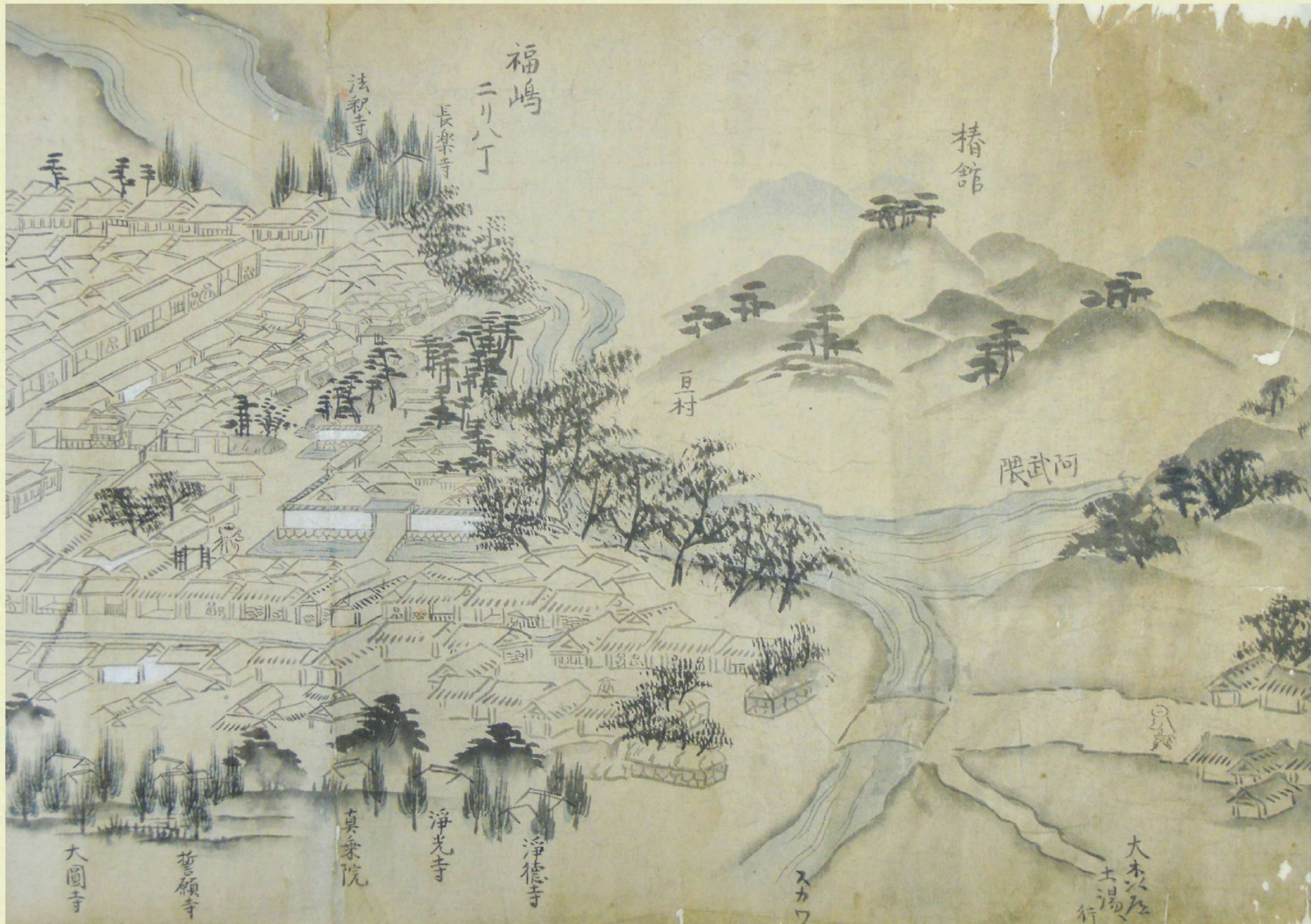
奥州道中絵図 (木目沢伝重郎家文書 1)