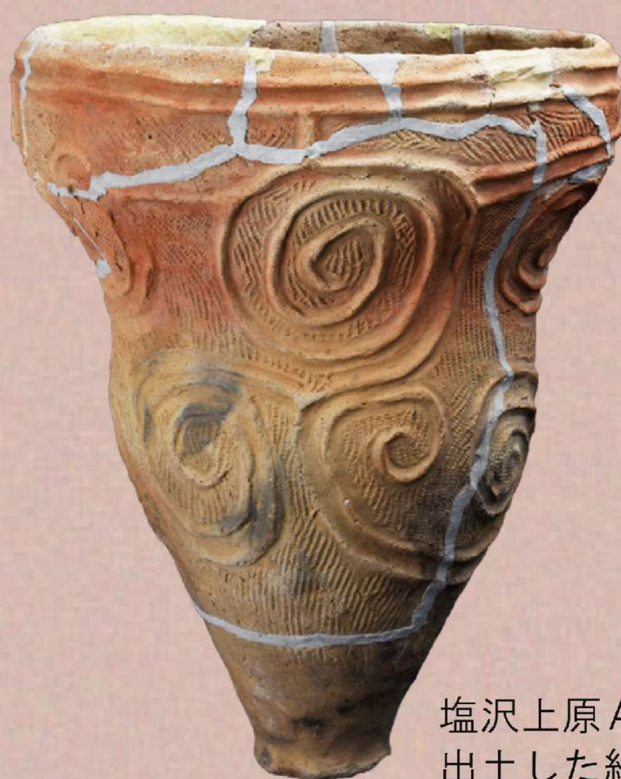
塩沢上原A遺跡にて出土した縄文土器

日本が空前の好景気に沸いた高度経済成長期。全国各地に高速交通網が整備される一方で、開発により失われる埋蔵文化財の保存が緊急課題として持ち上がった。