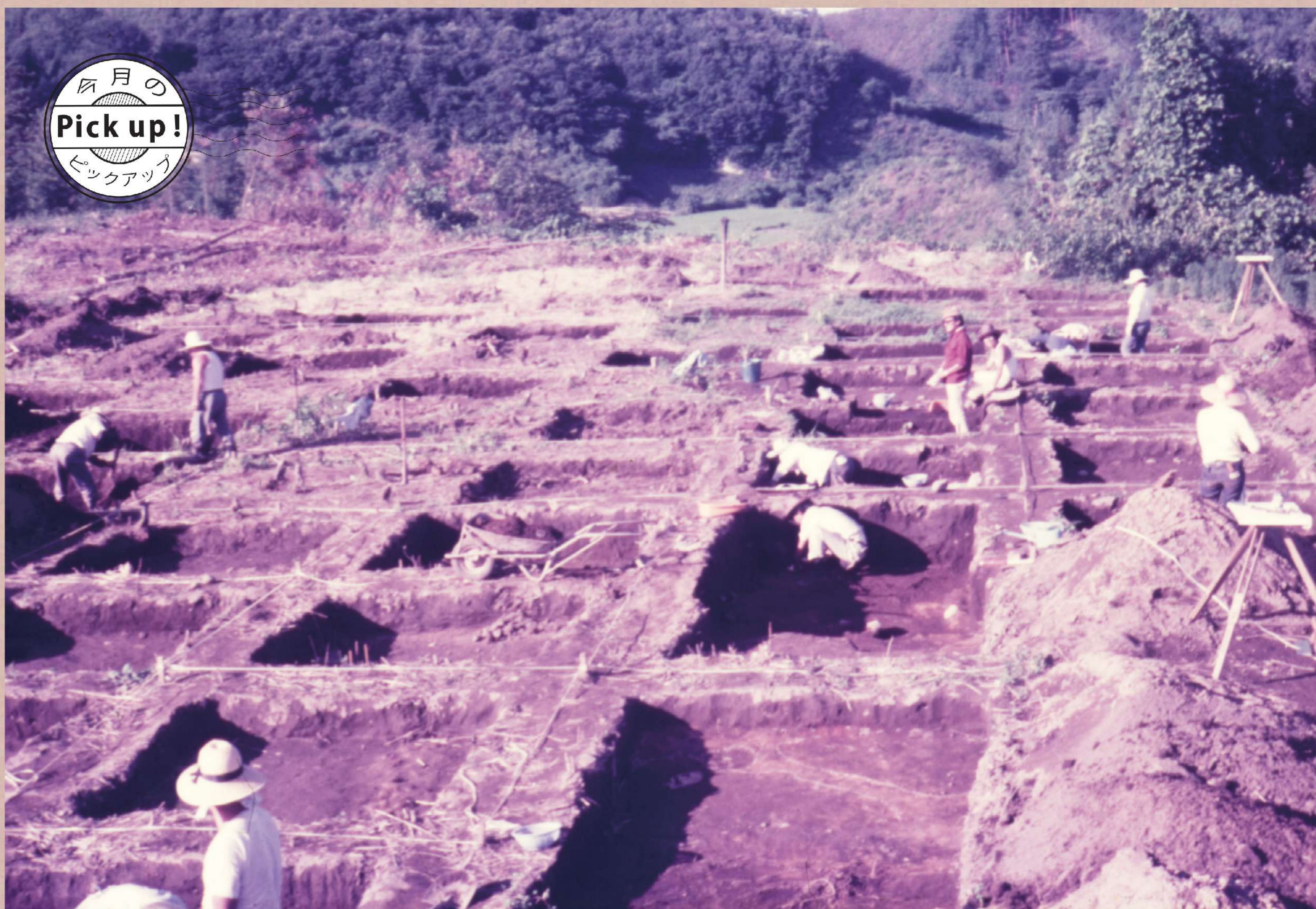
二本松市塩沢上原A遺跡調査風景