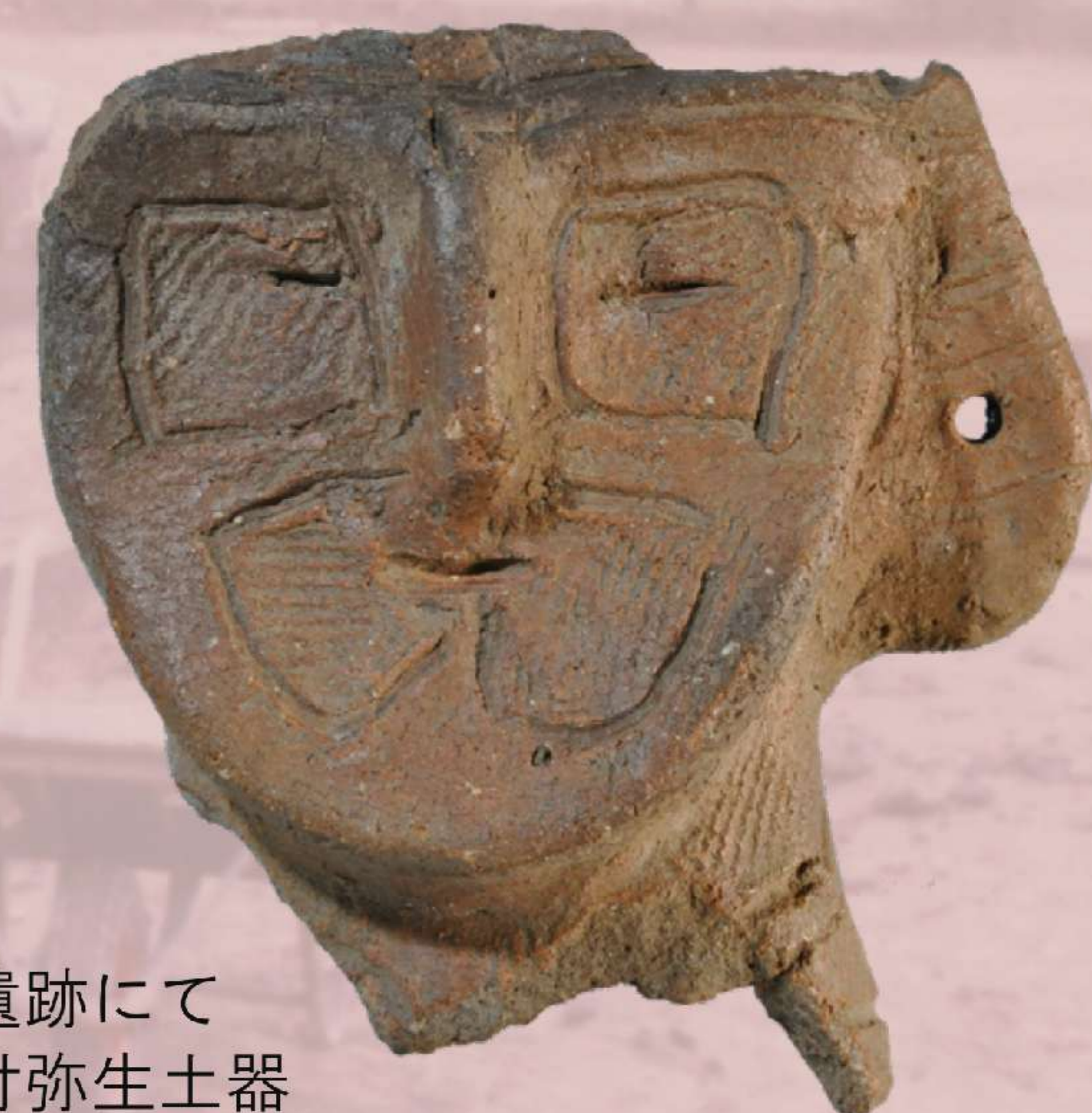
郡山市徳定A遺跡にて出土した人面付弥生土器