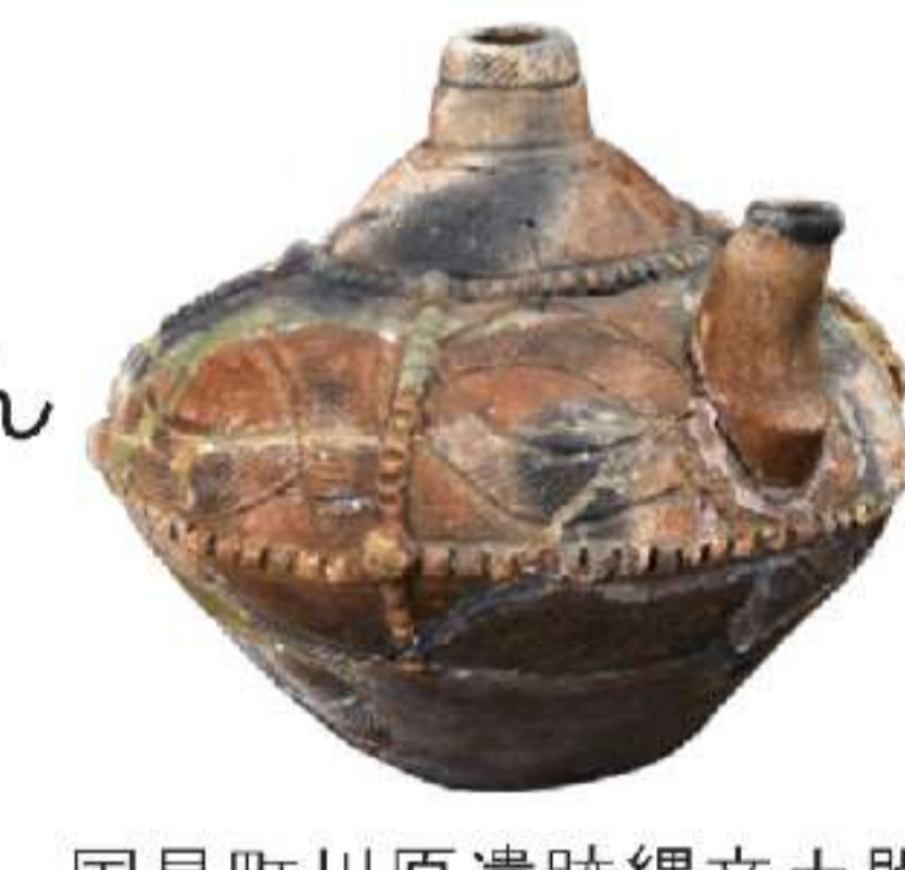
国見町川原遺跡縄文土器

4/2(火)～5/6(月・振休) 戦後ふくしまの考古学2 —高度経済成長期の発掘調査— 所 白河市、県文化財センター白河館まほろん 時 9:30～17:00 休 月曜日(4/29をのぞく)、4/30 料 無料 開 まほろん(0248)21-0700