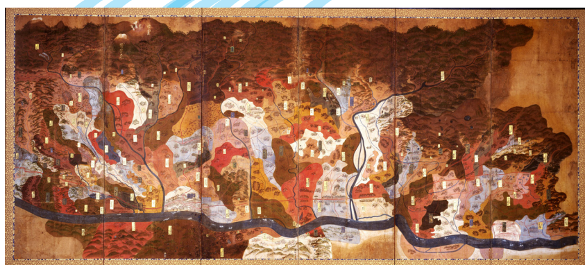
信夫郡の村々を流れる阿武隈川とその支流 「陸奥国信夫伊達惣検地高絵図屏風(右隻、福島県指定重要文化財)」 延宝2年(1674)頃 安斎直己家文書 38