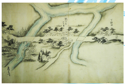
摺上川の流し木と阿武隈川 「奥州道中絵図(部分)」 18世紀後半頃 木目沢伝重郎家文書 1