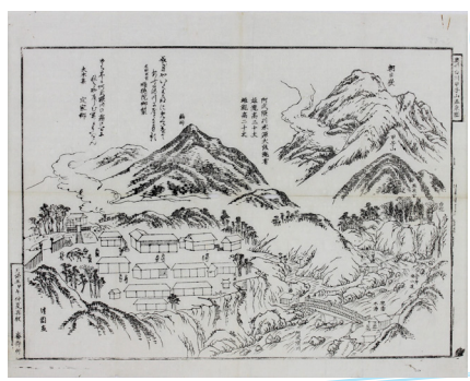
阿武隈川源流域と甲子温泉 「奥州白川甲子山温泉図」 天保5年(1834)仲夏 藤井二郎家文書 242

阿武隈川サミット発足 30 周年を記念して、主に江戸・明治時代の阿武隈川と支流に関する史料をご紹介します。上流域の中島村・二本松市間の通船路を描いた「舟運絵図」や、中流域の福島市・伊達市周辺を描いた「陸奥国信夫伊達惣検地高絵図屏風」、支流の摺上川で行われていた流し木に関する古文書などの展示を通して、阿武隈川流域の歴史と文化を振り返ります。